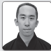
佐久間二郎 (さくま じろう)

観世喜之家(矢来能楽堂)、観世九阜会当主。重要無形文化財総合指定保持者(日本能楽会会員)。平成14年度文化庁芸術祭優秀賞・平成17年日本芸術院賞受賞。武田神社能楽殿「甲陽武能殿」を命名する。